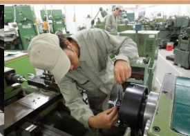
金属部品の測定 0.01mm 単位の測定