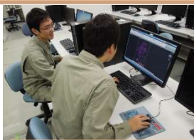
CAD を用いて図面作成