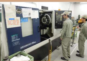
NC 旋盤、マシニングセンタ、 放電加工機

一連の流れを勉強したら、CAD/CAM を使用した加工や、応用課題の作成等の実習を行います。