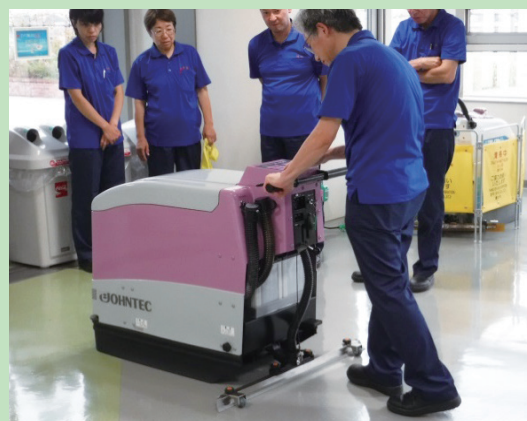
自動床洗浄機の実習