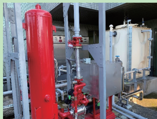
消火栓・スプリンクラー実習設備