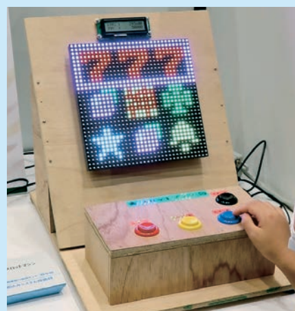
生徒作品(マイコン制御のスロットマシン)