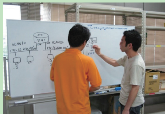
ネットワーク構成の検討(グループ作業)

また、実習にグループ作業を取り入れることにより、ネットワークエンジニアに必須のスキルの一つであるコミュニケーション能力を伸ばします。