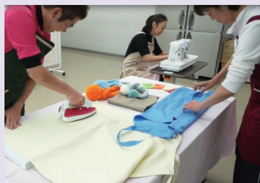
家事支援実習(被服)