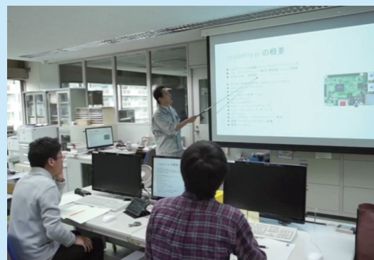
授業風景(プログラミング実習)

この科目では、ソフトウェア技術としては、主にC言語とJavaのプログラミングで、また、ハードウェア技術としては、電子回路の設計と組み立てなどで、最後に、システム設計技術としては、生徒自身による作品製作体験を通じて、それぞれ習得をしていきます。