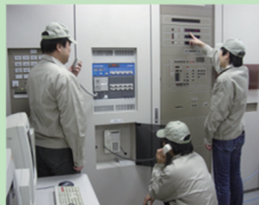
防災センター業務実習