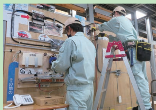
電話回線工事の実習