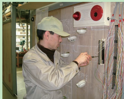
自動火災報知設備工事実習