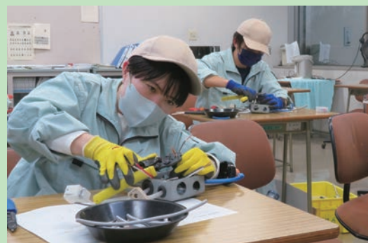
第二種電気工事士技能試験の練習風景