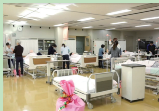
広い実習室と充実の設備