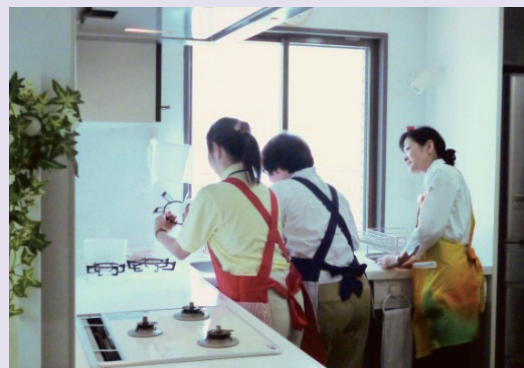
家事支援実習(キッチン掃除)