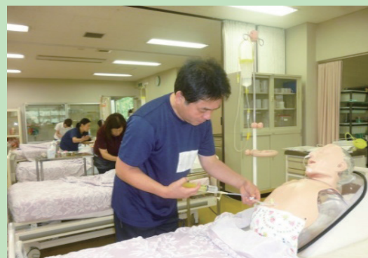
医療的ケア(経管栄養)

また、介護施設での実習などの豊富なカリキュラムにより、単に知識と資格取得だけではなく、利用者に寄り添う介護職としての姿勢を学べます。