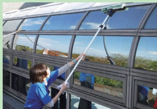
ガラスの清掃作業

この科目では、建物を美しく保ち、利用者のために清潔で快適な環境を作るために必要な清掃の技能と知識を学びます。ハウスクリーニング・ビルクリーニングそれぞれの特性に合わせた作業を的確に行えるよう、洗剤の選び方や資機材の使い方など知識・技能を基礎から学んでいきます。また、民間の研修施設で客室清掃整美等を体験するなど、幅広く学ぶことができます。