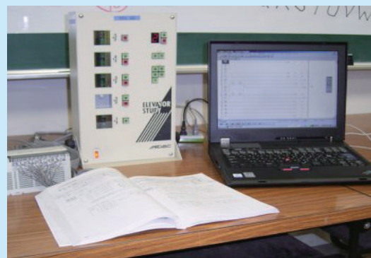
自動制御実習教材(エレベーター)

この科目では、電気工事、電気設備の施工や点検に加え、エレベーターなどで使われる自動制御についても学んでいきます。基礎から学びますので、電気の知識がなくても大丈夫です。授業の中では第一種及び第二種電気工事士の試験対策を行いますので、資格取得後に自信をもって就職活動ができます。