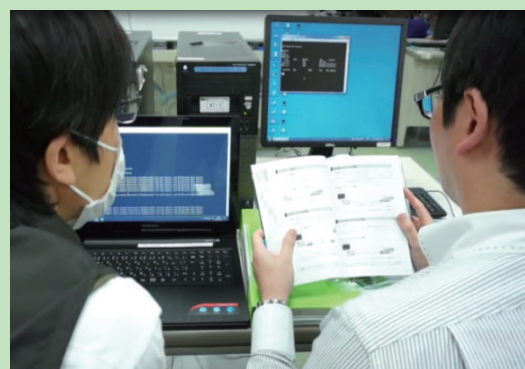
ネットワーク機器の設定