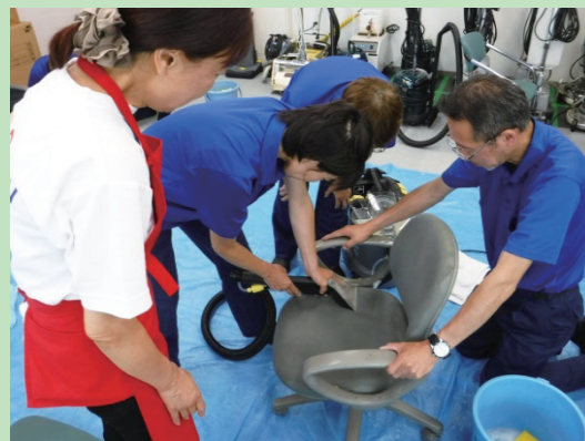
椅子の丸洗い作業