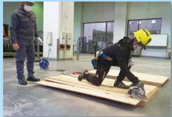
丸のこ等取扱い作業者安全衛生教育