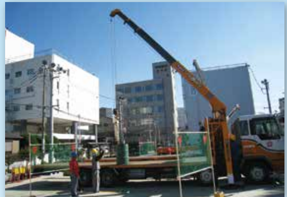
小型移動式クレーン運転技能講習