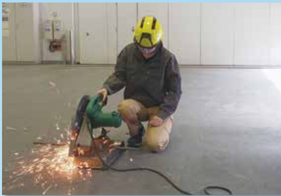
自由研削用といし特別教育