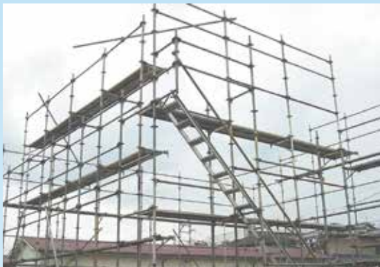
足場の組立て等特別教育(実技は行いません)