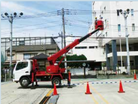
高所作業車運転技能講習