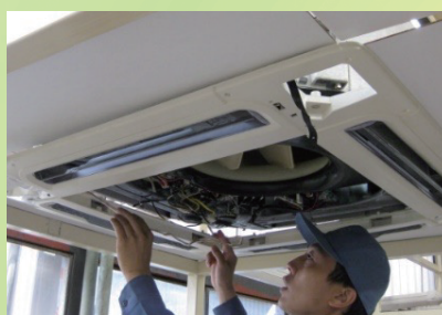
業務用エアコン取付