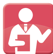
経理・経営・事務