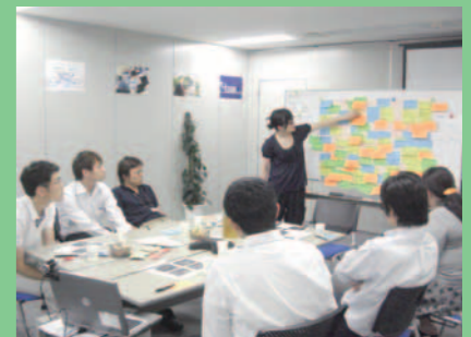
「みんなの意見を集める会」