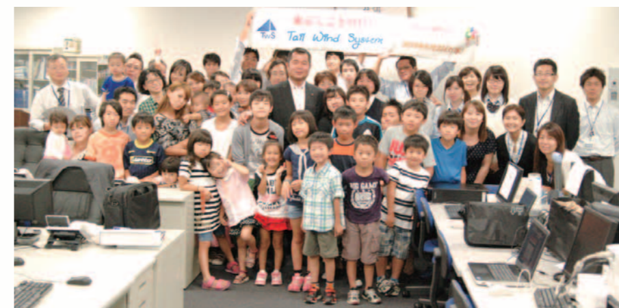
2012年8月 ファミリーデー実施